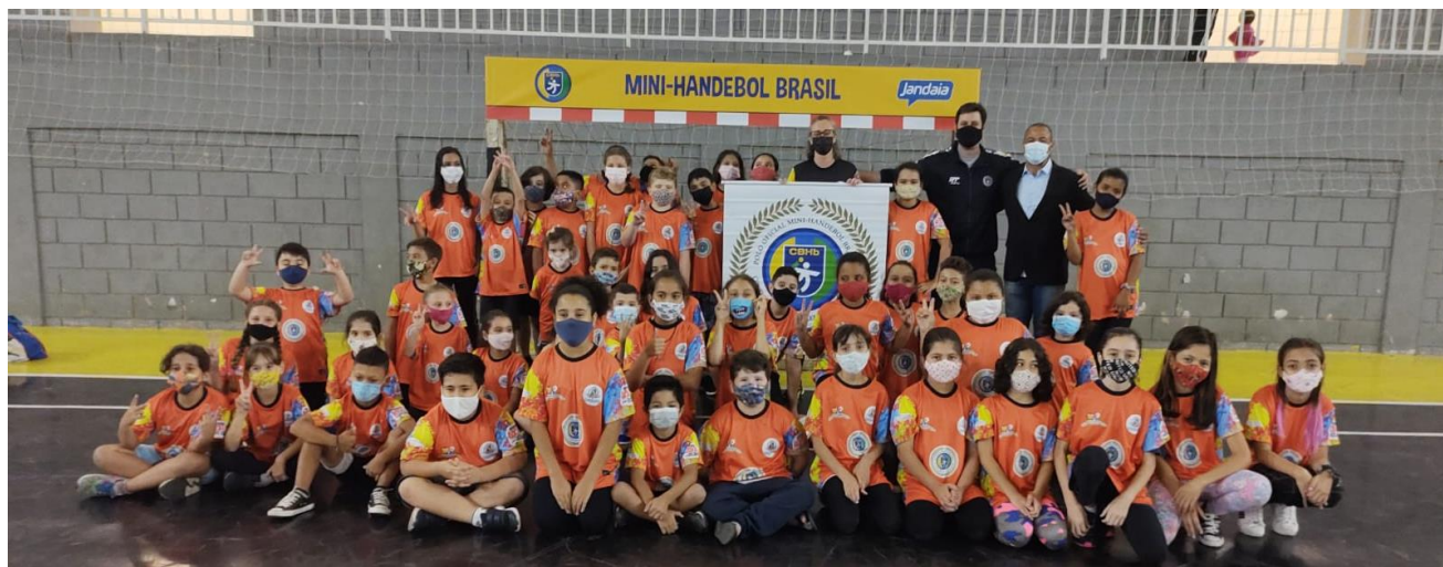
Foto 30: Inauguração oficial do polo Prefeitura Municipal de Votorantim.