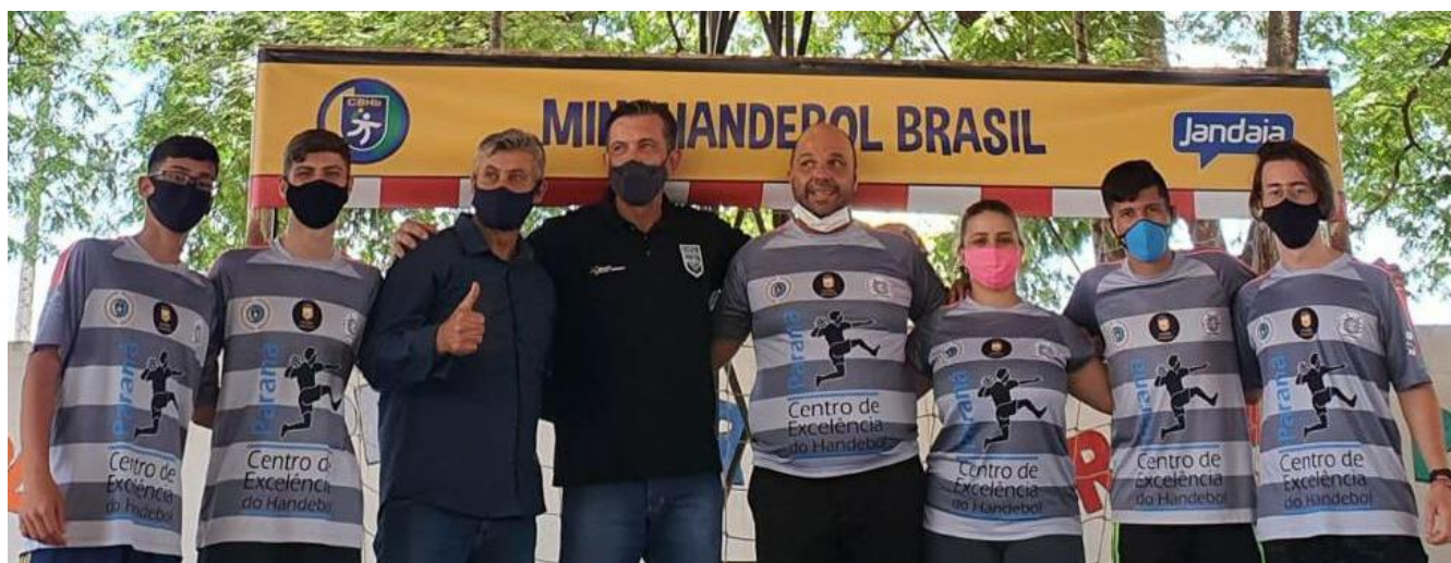
Foto 32: Inauguração oficial dos polos de Alto Paraná, a cidade com maior número de polos oficiais em todo Brasil.