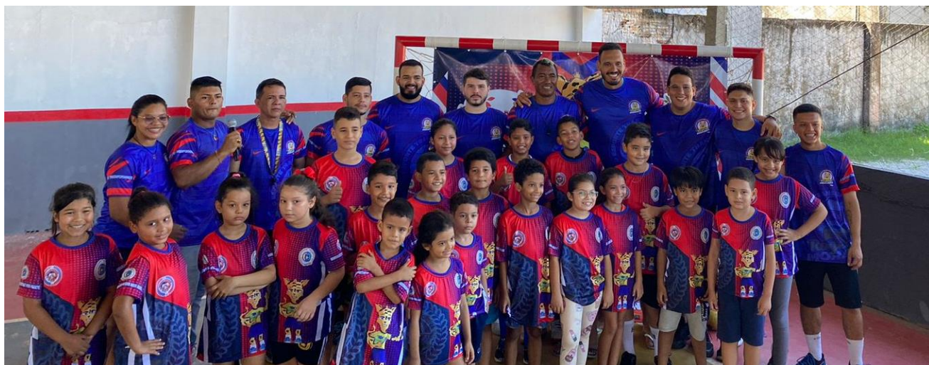
Foto 3: Mini-Handebol Associação Desportiva Novo Abaeté, com presença ilustre do atleta da seleção brasileira de handebol Rogério Moraes, embaixador do Mini-Handebol Brasil.