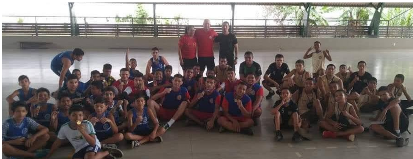
Foto 1: Mini-Handebol e Handebol da Escola Diogo Feijó, polo oficial.