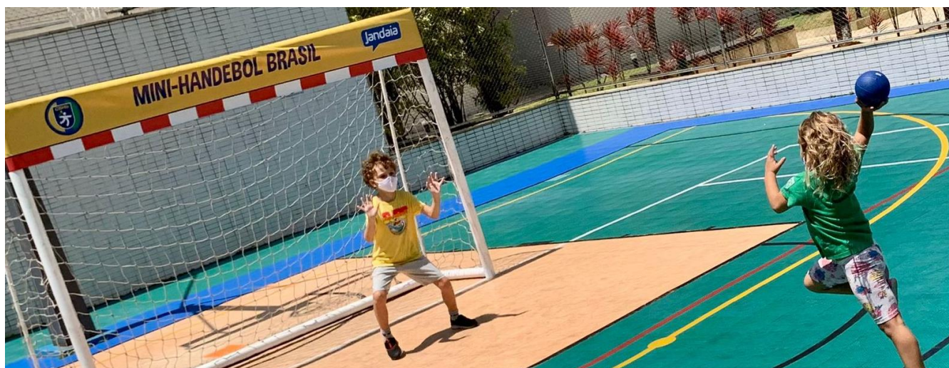
Foto 29: Inauguração oficial do polo Condomínio Enseada das Orquídeas.