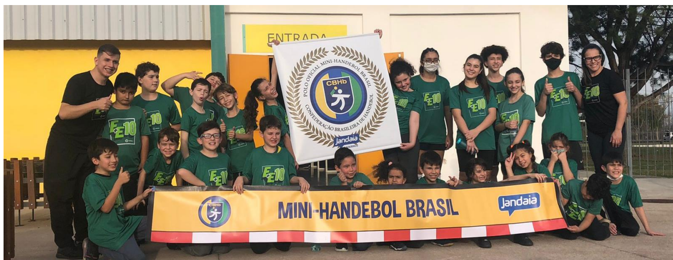
Foto 34: Mini-Handebol do Centro de Esporte e Lazer Avelino Vieira – Polo Oficial.