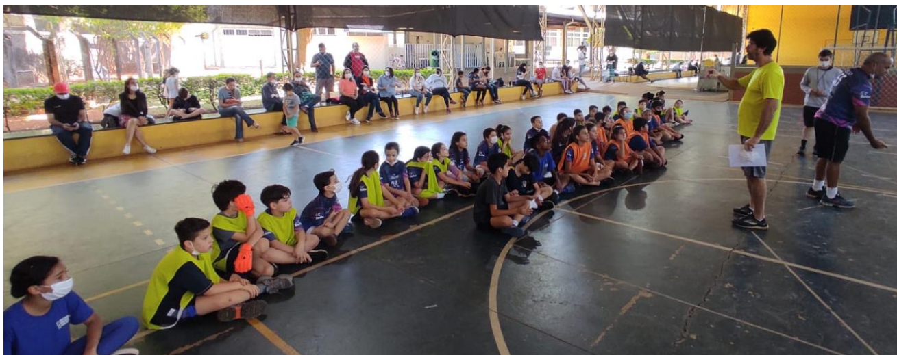
Foto 22: Festival de Mini-Handebol na Escola de Educação Básica (ESEBA/UFU).