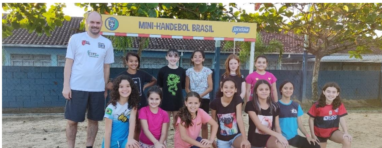
Foto 38: Turma do Mini-Handebol Massaranduba, que além de ser polo do mini-handebol de quadra também tem a chancela do Mini-Handebol de Praia Brasil.